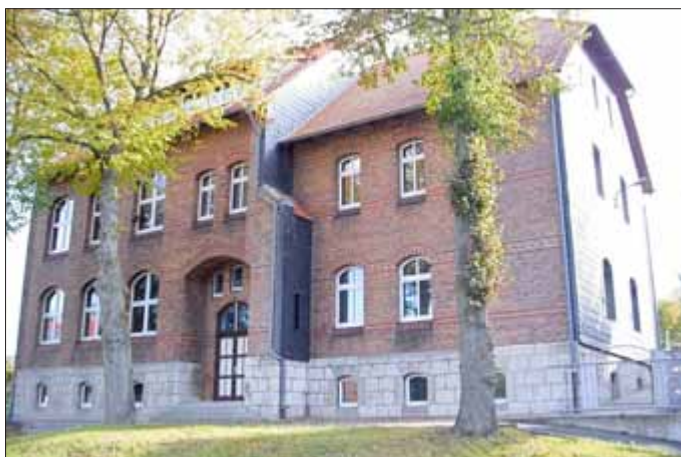
Straßenansicht, Haupteingang ehemaliges Schulgebäude