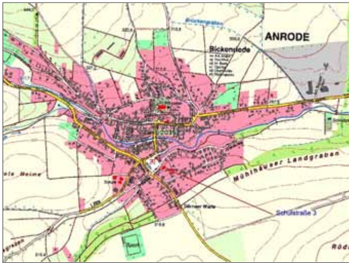
Ausschnitt Übersichtskarte Bickenriede