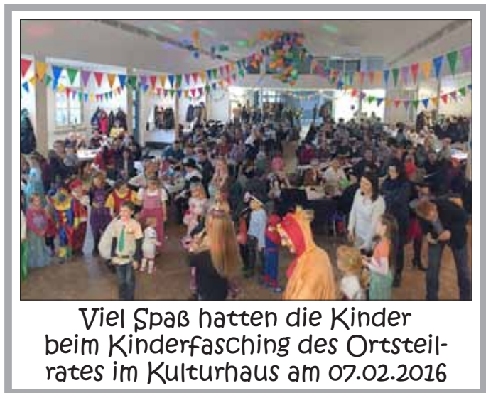
Viel Spaß hatten die Kinder beim Kinderfasching des Ortsteilrates im Kulturhaus am 07.02.2016